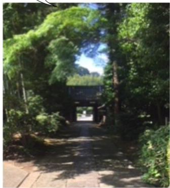
正門裏側の景色も趣あり